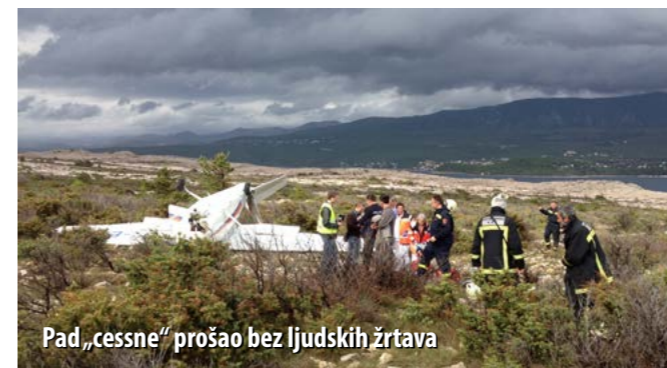
Pad „cessne“ prošao bez ljudskih žrtava

Najčešće intervencije koje obavlja spasilačko-vatrogasna služba u ZL Rijeka odnose se na otklanjanje posljedica manjih izlivanja ulja ili goriva iz zrakoplova dok su parkirani na platformi. – Manje mrlje ispiramo, a ako je riječ o većim mrljama, najprije ih posipamo pijeskom pa zatim ispiramo. Isto tako, ako dođe do pregrijavanja motora zrakoplova, pristupamo njegovom hlađenju. Ponekad nam problem stvaraju i divlje životinje, npr. lisice koje se znaju zaplesti u zaštitnu mrežu postavljenu oko zračne luke pa i to rješavamo. Ponekad pak moramo tjerati ptice s uzletno/sletne staze, za što koristimo poseban pištolj koji stvara veliku buku. No, najveći dio našeg posla, nasreću, je prevencija, a u tom smislu za nas je potencijalno najopasnija situacija, pored slijetanja i uzlijetanja zrakoplova – kada su opterećenja motora i stajnoga trapa najveća, situacija kada se zrakoplov puni gorivom, a u njemu se nalaze putnici u tranzitu. Tada smo u najvišem stupnju pripravnosti, navodi Keglević, a upozorava i na mnoge nepredvidive situacije – poput nenajavljenih zahtjeva za slijetanjima, uglavnom malih zrakoplova, zbog kvarova na motoru, nedostatka goriva i sl.