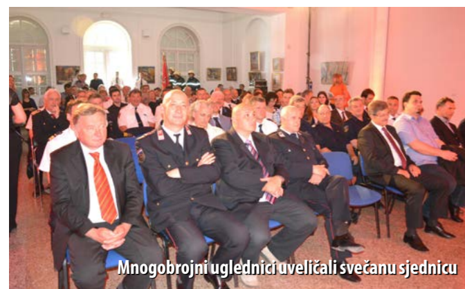
Mnogobrojni uglednici uveličali svečanu sjednicu

JVP Opatija djeluje na području od 310 km 2 i „pokriva“ područje Grada Opatije te općina Lovran, Matulji i Mošćanička Draga. Pod okriljem Područne vatrogasne zajednice Liburnije objedinjuje svoj rad s DVD-ima Opatija, Lovran, Učka, Kras-Šapjane i Sisol. JVP Opatija na godinu ima oko 400 intervencija, a najčešće je riječ o gašenju požara, tehničkim intervencijama u prometu te spašavanju ljudi.