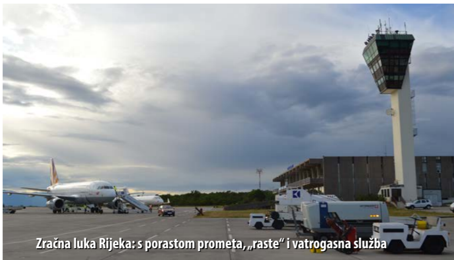
Zračna luka Rijeka: s porastom prometa, „raste“ i vatrogasna služba

Zračna luka Rijeka danas ima dobro organiziranu spasilačko-vatrogasnu službu koja može odgovoriti svim izazovima vatrogasne struke i zahtjevima proizašlim iz specifičnosti koje ima svaka zračna luka. U 45 godina rada Zračne luke Rijeka dogodilo se nekoliko većih incidenata, a najveća tragedija zbila se 23. svibnja 1971. godine kada je pri padu zrakoplova poginulo 73 ljudi.