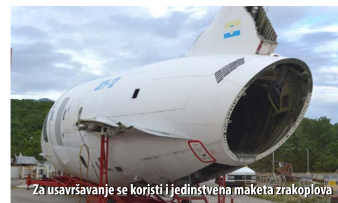
Za usavršavanje se koristi i jedinstvena maketa zrakoplova