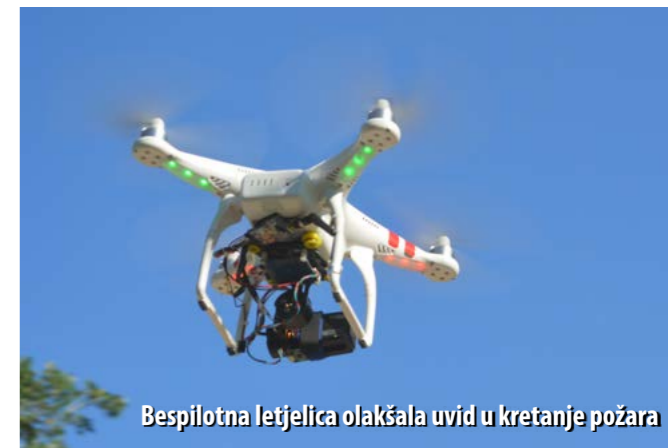
Bespilotna letjelica olakšala uvid u kretanje požara

Cilj je vježbe bio utvrditi usklađenost djelovanja i koordinacije otočnih vatrogasnih snaga, osobito JVP-a Grada Krka te DVD-ova Baška, Krk, Vrbnik i Dobrinj, kao i njihove opreme i tehnike. Također je obavljena provjera učinkovitosti vatrogasnih snaga kod požara većeg razmjera i iznenadnih situacija u sprečavanju širenja požara pod utjecajem jakog vjetera (bure) po ravnoj površini, premještanja snaga, snalaženja u uvjetima pomanjkanja vode te provjera dobave vode iz alternativnih izvora. Prvi put u vježbi su sudjelovale i snage dislociranih odjeljenja DVD-a Krk s područja općina Malinske i Punta, odnosno novoobučeni vatrogasci koji su prije mjesec dana položili ispit za