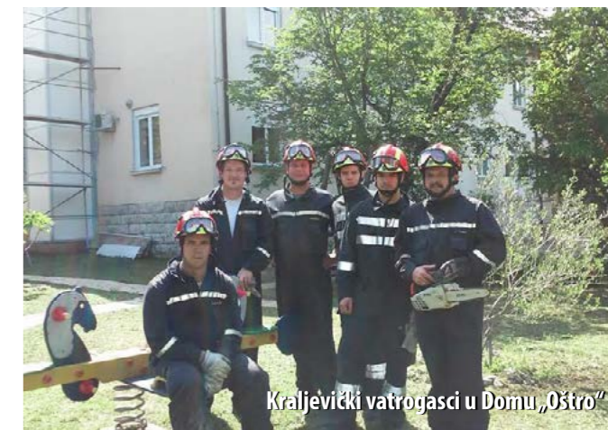
Kraljevički vatrogasci u Domu „Oštro“

Tijekom Mjeseca zaštite od požara, članovi operative DVD-a Kraljevica posjetili su Dom za djecu i mladež „Oštro“, dok su prostorije vatrogasnoga doma posjetila djeca Osnovne škole „Kraljevica“.