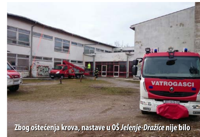
Zbog oštećenja krova, nastave u OŠ Jelenje-Dražice nije bilo