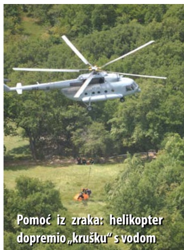
Pomoć iz zraka: helikopter dopremio „krušku“ s vodom