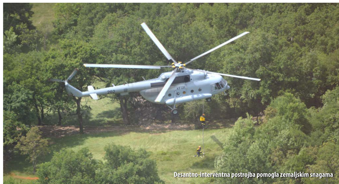
Desantno-interventna postrojba pomogla zemaljskim snagama

Uoči ljetne sezone, i ove su godine, potkraj svibnja, županijske vatrogasne snage održale taktičko-pokaznu vježbu gašenja požara na otvorenom. Bila je to idealna prilika za provjeru koordiniranosti vatrogasnih postrojbi, kontrolu opreme i tehnike, kao i testiranje funkcioniranja sustava veza.