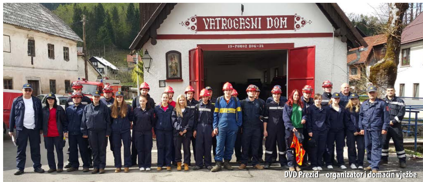
DVD Prezid – organizator i domaćin vježbe

U Prezidu je 26. travnja održana međunarodna vatrogasna vježba gašenja požara trave i niskoga raslinja u neposrednoj blizini državne granice sa Slovenijom. Vježbu je organizirao DVD Prezid, pod pokroviteljstvom Vatrogasne zajednice grada Čabra.