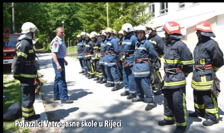
Polaznici Vatrogasne škole u Rijeci

Uoči Skupštine, u Šapjanama je četvrta generacija Vatrogasne škole Zagreb – Područne jedinice Rijeka polagala završni ispit. U sklopu ispita, kadeti su izveli završnu pokaznu vježbu gašenja građevinskog objekta i spašavanja ugroženih osoba, a sve je nadgledao Dario Gauš, jedan od predavača u Vatrogasnoj školi i instruktora VZPGŽ-a.