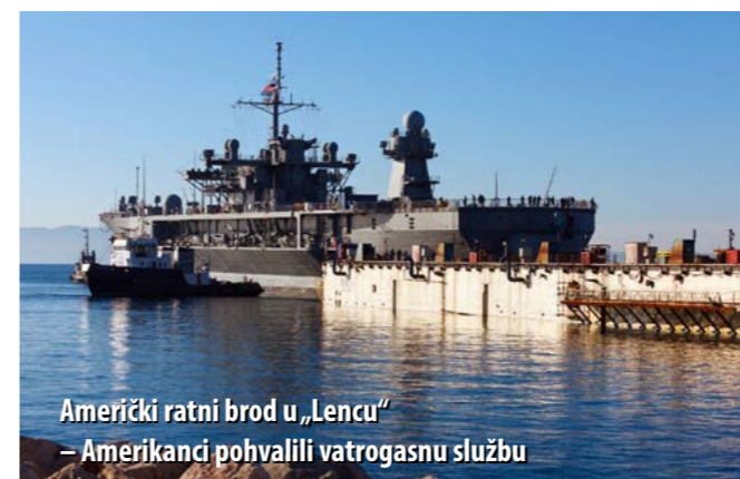
Američki ratni brod u „Lencu“ – Amerikanci pohvalili vatrogasnu službu

- Remontna brodogradilišta razlikuju se od drugih brodogradilišta po tome što u remont dolaze brodovi koji uglavnom imaju mnogo gorivog materijala (za razliku od novogradnje gdje tek u završnoj fazi na brod dolazi gorivo). U „Lencu“, kao i u svim drugim remontnim brodogradilištima, cijelo vrijeme trajanja tehnološkog procesa treba posebnu pozornost posvetiti velikoj količini gorivih tvari koje se nalaze na brodovima i predstavljaju latentnu opasnost, osobito ako se izvode neki veći