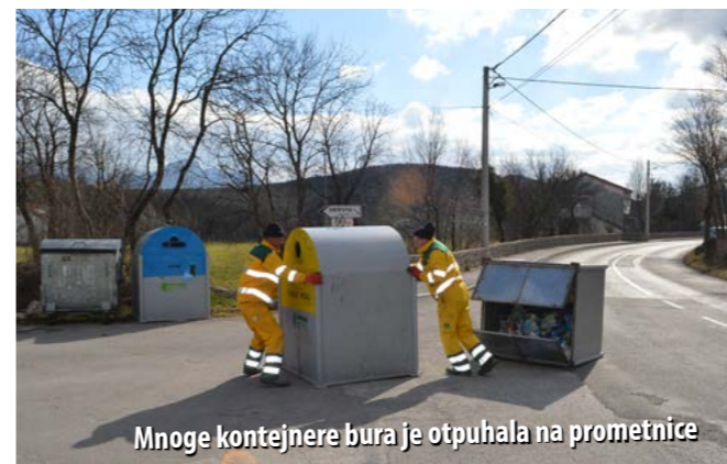
Mnoge kontejnere bura je otpuhala na prometnice

Prema riječima Hinka Mancea, zapovjednika JVP-a Rijeka, riječke vatrogasne snage, kao i pripadnici svih dobrovoljnih vatrogasnih društava iz tzv. „riječkoga prstena“, u 48 sati imale su stotinjak intervencija. Najviše intervencija bilo je zbog srušenih