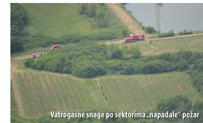
Vatrogasne snage po sektorima „napadale“ požar