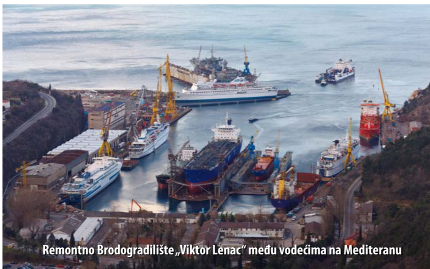
Remontno Brodogradilište „Viktor Lenac“ među vodećima na Mediteranu

Povijest zaštite od požara u remon-tnom Brodogradilištu „Viktor Lenac“ d.d. stara je koliko i samo brodogradilište. Oduvijek je brodogradilište imalo barem nekoliko profesionalnih vatrogasaca, a 1953. godine pod okriljem „Lenca“ osnovan je i industrijski DVD koji je u svojim „najboljim“ danima imao više od 100 članova, uglavnom radnika „Lenca“. Društvo je imalo svoju profesionalnu jezgru, a radilo se uglavnom u jednoj smjeni. S porastom opsega poslova i razvojem brodogradilišta, razvijala se i vatrogasna djelatnost. DVD se nakon Domovinskoga rata rasformirao, a ojačana je profesionalna vatrogasna postrojba.