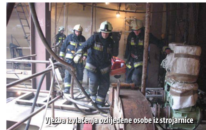
Vježba izvlačenja ozljeđene osobe iz strojarnice

Svjesni da samo sustavnim osposobljavanjem vatrogasne postrojbe mogu povećati njezinu učinkovitost, u 3. MAJU redovito provode vježbe, sukladno Planu i programu vježbi.