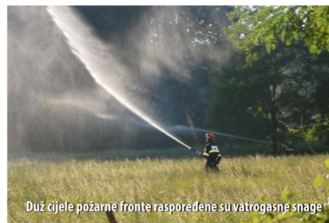
Duž cijele požarne fronte raspoređene su vatrogasne snage

Prva je na mjesto požara stigla ekipa DVD-a Baška koja s dva mlaza započinje gašenje, a dio vatrogasaca s naprtnjačama tretira požarnu frontu. Potom stiže JVP Grada Krka i uključuje se u intervenciju. Budući da se radilo o većem požaru kojim je bilo ugroženo i nekoliko drvenih objekata, pozvane su dodatne snage, tj. pripadnici DVD-ova Krk, Vrbnik i Dobrinj, a pozvani su i članovi dislociranih odjeljenja DVD-a Krk, zaduženi za područje općina Malinska-Dubašnica i Punat. U međuvremenu je na teren stigao i zapovjednik PVZ-a otoka Krka koji je, procijenivši da bi požar mogao poprimiti veće razmjere, požarište podijelio na dva sektora, pregrupirao snage na terenu i odredio zapovjednike. Pri gašenju požara korištena su navalna i vozila za gašenje otvorenog prostora, a zbog nepristupačnog terena, veći broj vatrogasaca djelovao je i naprtnjačama. Za dobavu dodatnih količina vode iz Vele Rike korištena je prijenosna pumpa. Ukupno je u vježbi sudjelovalo 58 vatrogasaca s 13 vozila.