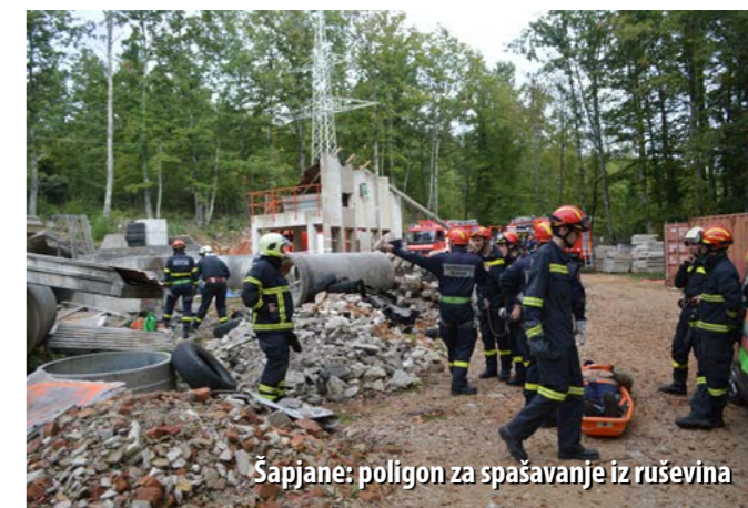
Šapjane: poligon za spašavanje iz ruševina

U PGŽ-u djeluje šest javnih vatrogasnih postrojbi i 59 DVD-ova. Što se javnih postrojbi tiče, uglavnom su smještene u prostorima koji imaju mnoge manjkavosti, a posebno se to odnosi na Opatiju, Mali Lošinj i Crikvenicu, iako se ni JVP Rijeka, kao najjača županijska postrojba, ne može podičiti idealnim uvjetima, osobito što se prostora za vježbe tiče. - Dijelimo sudbinu drugih hrvatskih sredina, ali od postojećih kapaciteta nastojimo izvući maksimum kaže Šćulac te u tom kontekstu navodi da je obučni centar u Šapjanama idealno rješenje. - Šapjane su preduvjet našeg razvoja. To je naš strateški projekt na kojem radimo već nekoliko godina. Dosad smo tamo uredili poligon za ruševine, flashover simulator, uređen je i jedan bungalov za predavanje. Spomenimo još jedan bungalov za rad s izolacijskim aparatima te praonicu za vatrogasna odijela. Sljedeći korak bit će rekonstrukcija glavne zgrade za što očekujemo i EU-financiranje. Tu bismo uredili još nekoliko učionica, centralu za preuzimanje poziva, stožernu soba te prehrambeni centar. U planu je i uređenje smještajnih kapaciteta sa 70-ak ležajeva, kao i uređenje skladišnog prostora koji bi bio namijenjen svim žurnim službama. Smisao je da Šapjane postanu regionalni centar za obuku svih službi kojima je taj tip poligona potreban, navodi Šćulac.