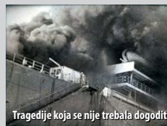
Tragedije koja se nije trebala dogoditi

U dosadašnjoj povijesti 3. MAJA svakako najveća katastrofa dogodila se u rujnu 1971. godine, kada je došlo do velikoga požara na brodu Ragna Gorthon . Do požara je došlo zbog nepažnje i nedovoljnog opreza. Naime, dan uoči probne vožnje, 17. rujna, na brodu su se obavljali završni radovi, među ostalim i ispitivanje protoka dizelskoga goriva. Cjevovi su zbog popravka skinuli jednu cijev iz sustava cjevovoda za dovod goriva, što stručnjaci koji su ispitivali protok goriva nisu znali. Otvaranjem ventila, došlo do istjecanja goriva u strojarnicu u kojoj je u tijeku bilo zavarivanje. Raspršena nafta se u dodiru s užarenom površinom zapalila i u kratkom vremenu ispunila strojarnicu gustim dimom i plamenom te se proširila i na nadgrađe broda. Unatoč nadljudskim naporima vatrogasaca i samih radnika, požar je gašen nekoliko sati, a 15 je radnika smrtno stradalo.