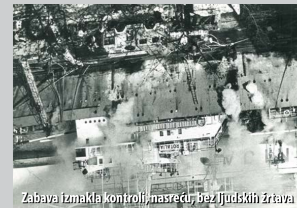
Zabava izmakla kontroli, nasreću, bez ljudskih žrtava

Od većih intervencija u povijesti Brodogradilišta „Viktor Lenac“ valja izdvojiti požar na bugarskom brodu „Rotalia“, 1980. godine. Radilo se o ribarskome brodu na kojem je požar izazvala posada prilikom proslave Nove godine. Gašenje požara trajalo je od pet sati ujutro do kasno navečer, sudjelovali su i pripadnici riječkih profesionalaca te remorkeri. Šteta je bila velika, ali ozlijeđenih nije bilo.