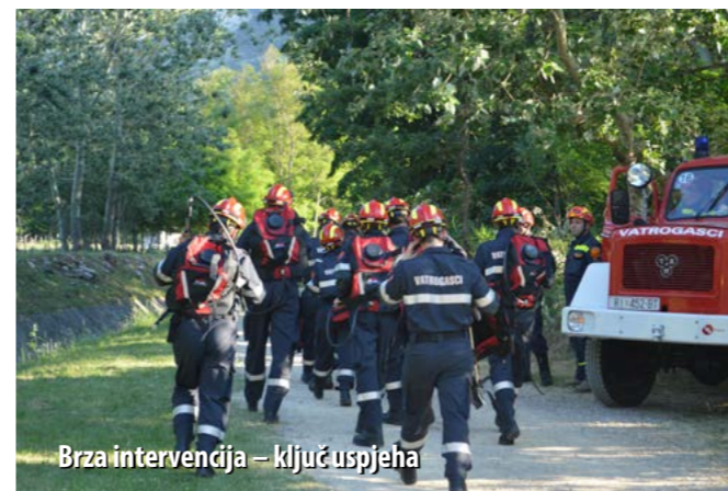
Brza intervencija – ključ uspjeha