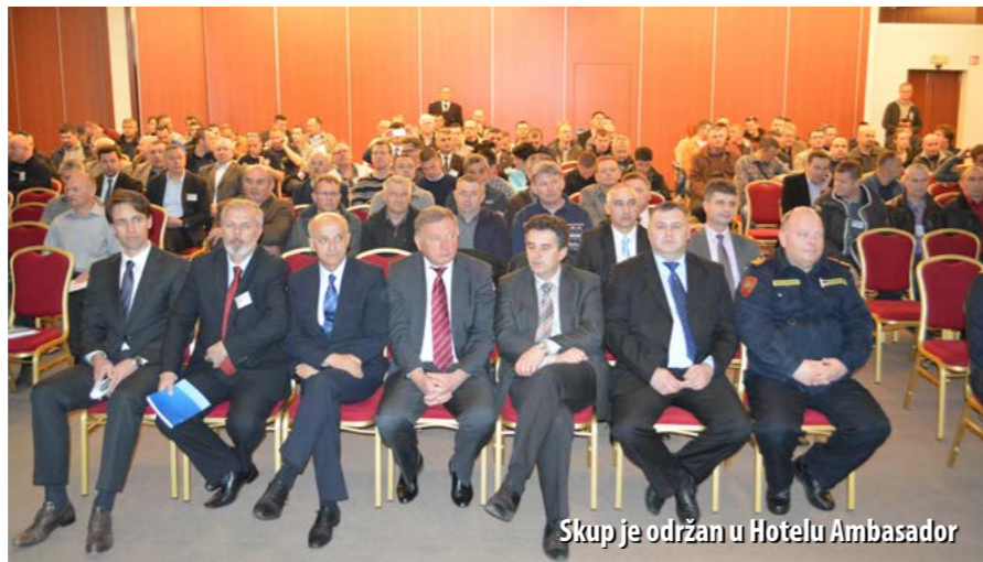
Skup je održan u Hotelu Ambassador

Programom ovogodišnjega stručnoga skupa obuhvaćeno je dvadesetak tema, podijeljenih u četiri tematska bloka od kojih se prvim, onim o prirodnim nesrećama, željelo upozoriti na činjenicu da su upravo prirodne nesreće u porastu u cijelome svijetu. Više od 58 posto intervencija događa se upravo zbog prirodnih nesreća, o čemu se i Hrvatska osvjedočila prošle godine kada je ledena kiša izazva-