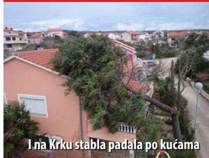
I na Krku stabla padala po kućama

Pored porušenih stabala koja su padala na kuće, krčki su vatrogasci intervenirali i na zgradi Konzuma, na ulazu u Omišalj, čiji je krov pod naletima jakoga vjetrova u potpunosti uništen.