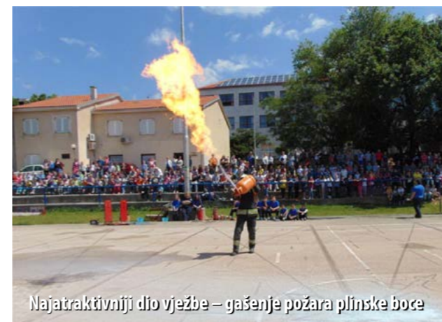
Najatraktivniji dio vježbe – gašenje požara plinske boce

Operativna postrojba DVD-a San Marino - Novi Vinodolski u sklopu „Svibnja – mjeseca zaštite od požara“ izvela je pokaznu vatrogasnu vježbu na igralištu malih sportova ispred osnovne škole u Novom Vinodolskom.