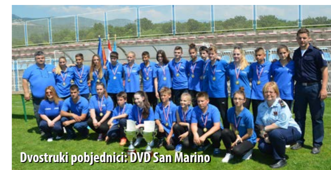
Dvostruki pobjednici: DVD San Marino

U lipnju je u Novom Vinodolskom održano županijsko vatrogasno natjecanje djece i mladeži na kojemu se okupilo 40-ak ekipa.