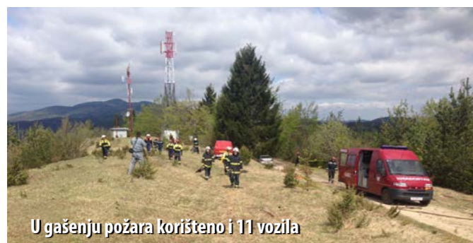
U gašenju požara korišteno i 11 vozila

Prema zamišljenom scenariju, dojavu o požaru vatrogasci su zaprimili u 10.30 h nakon čega su prvi na teren izašli članovi DVD-a Prezid. Budući da je požarom zahvaćeno oko pet hektara površine, u pomoć su pozvana sva susjedna društva iz Vatrogasne zajednice Čabra - DVD Tršće, DVD Gerovo, DVD Čabar i DVD Plešce, kao i susjedna društva iz Slovenije - PGD Babno Polje i PGD Podpreska. U vježbi su sudjelovali i predstavnici susjedne slovenske vatrogasne zajednice (GZ Vojnik