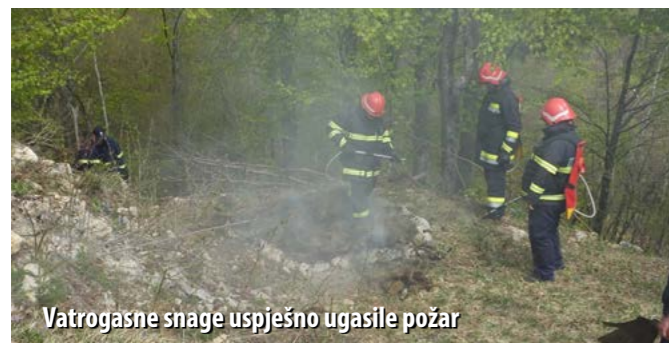
Vatrogasne snage uspješno ugasile požar

U Prezidu je 26. travnja održana međunarodna vatrogasna vježba gašenja požara trave i niskoga raslinja u neposrednoj blizini državne granice sa Slovenijom. Vježbu je organizirao DVD Prezid, pod pokroviteljstvom Vatrogasne zajednice grada Čabra.