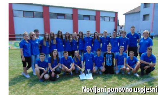
Novljani ponovno uspješni