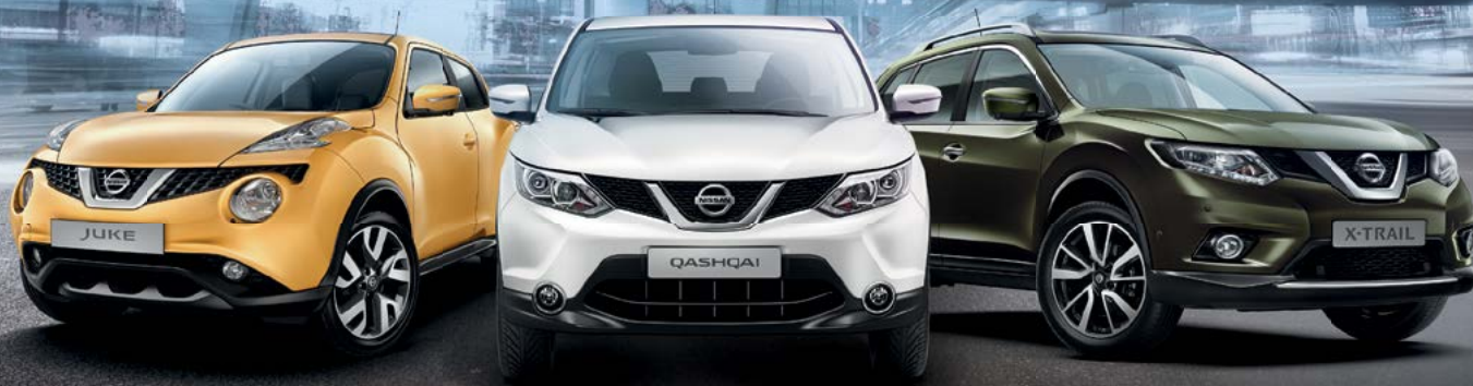
NOVI NISSAN JUKE