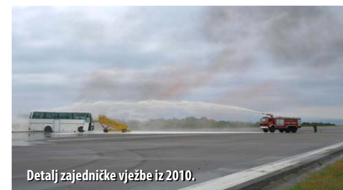
Detalj zajedničke vježbe iz 2010.