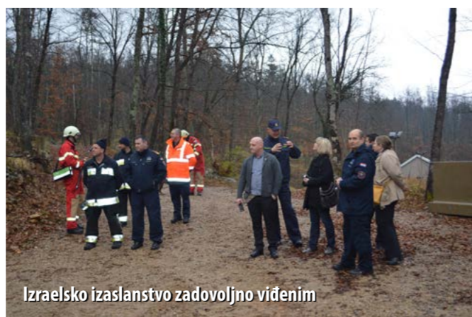
Izraelsko izaslanstvo zadovoljno viđenim

Spomenuti je posjet organiziran sukladno iskazanom interesu izraelskih vatrogasaca da uspostave stručnu suradnju s vatrogasnim stručnjacima VZPGŽ-a i to ponajprije na planu eduka-