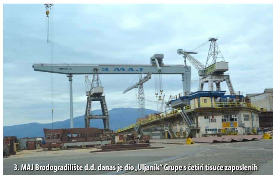
3. MAJ Brodogradilište d.d. danas je dio „Uljanik“ Grupe s četiri tisuće zaposlenih

O zaštiti od požara u riječkome brodogradilištu trenutačno brine postrojba od 32 pripadnika, od čega je 28 operativnih vatrogasaca, dva inženjera zaštite od požara te dva operatera veze. Postrojba je opremljena s dva vozila, a ove godine u planu je nabava još jednog. U sklopu Brodogradilišta djeluje i sanitetska služba koja ima i svoje kombi vozilo.