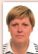
Piše: Vanda Radetić-Tomić