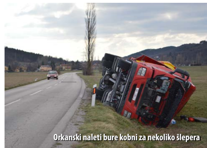
Orkanski naleti bure kobni za nekoliko šlepera

Već uobičajeno, tri „marčane“ bure svake godine zadaju probleme u primorskom kraju. Tako je bilo i ove godine, a najviše problema izazvala je prva „marčana“ bura koja se na Primorje obušila 5. ožujka u ranim jutarnjim satima.