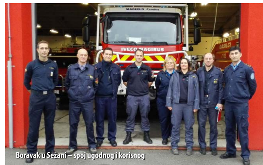
Boravak u Sežani – spoj ugodnog i korisnog