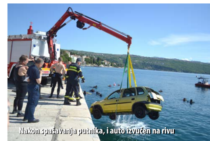
Nakon spašavanja putnika, i auto izvučen na rivu

Prema zamišljenom scenariju vježbe, automobil s dvoje putnika sletio je u opatijskoj luci u more. Brzom intervencijom vatrogasaca, vozač i suvozač su spašeni, a vozilo je izvučeno na rivu. Vatrogasci su najprije zbrinuli ozlijeđene putnike i gumenjakom ih dovezli do obale gdje ih je spremno dočekala ekipa Hitne pomoći. Potom se pristupilo izvlačenju automobila s morskoga dna. Ronioci su pomoću balona podigli vozilo s morskoga dna, približili ga obali te pomoću kamiona-dizalice podigli na rivu. Prvi put cijela je akcija snimana i podvodnim kamerama, što će se iskoristiti prilikom budućih edukativnih radionica.