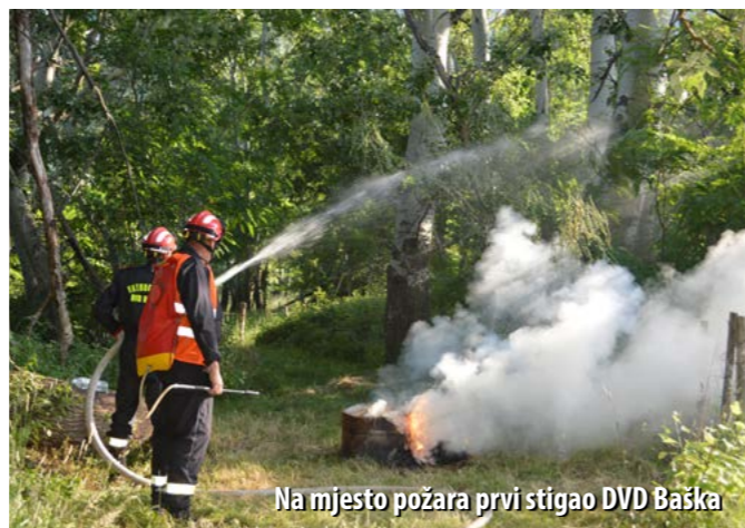
Na mjesto požara prvi stigao DVD Baška

Prema scenariju vježbe, požar je izbio na rubnom dijelu šume, u blizini ceste, iznad autokampa Zablaće. U trenutku izbijanja požara na livadi uz rub šume nelegalno je ljetovala skupina mladih turista koja je izazvala požar (nakon loženja logorske vatre, otišli su u šetnju, a vatra koja nije bila do kraja ugašena, rasplamsala se i zahvatila okolno raslinje). Potpomognut vjetrovom, požar se naglo širio, što je zapazio mještani i obavijestio vatrogasce.