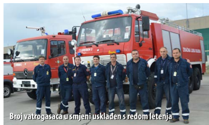
Broj vatrogasaca u smjeni usklađen s redom letenja

Nakon mnogih loših poslovnih godina i gubitaka, ZL Rijeka u posljednjih nekoliko godina bilježi pozitivne poslovne pomake. Napori Uprave napokon daju rezultate, a ove se godine očekuje i rekordna sezona, s rekordnim brojem zrakoplova i putnika. Za taj pojačan promet priprema se i spasilačko-vatrogasna služba. Neki pomaci već su učinjeni pa je tako broj vatrogasaca od prošlogodišnjih osam povećan na 12. – U tijeku je i nabava još jednog kamiona, tzv. teškog vatrogasnog vozila koje će pridonijeti poboljšanju rada vatrogasne službe, a u postupku