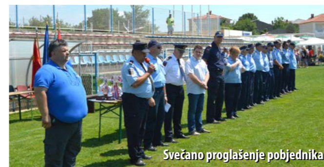
Svečano proglašenje pobjednika