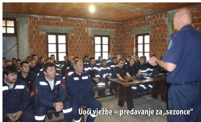
Uoči vježbe – predavanje za „sezonce“