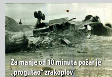
Za manje od 10 minuta požar je „progutao“ zrakoplov

Nedjelja, 23. svibnja 1971. godine u povijesti ZL Rijeka zauvijek će ostati upisana kao najtragičniji dan. Tog se dana prilikom slijetanja zapalio zrakoplov Tupoljev 134. Od