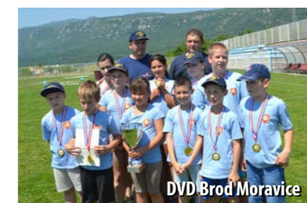
DVD Brod Moravice

U kategoriji djeca M pobijedio je DVD Brod Moravice, drugi je bio DVD Sušak 1, a treći DVD Kraljevica. U kategoriji