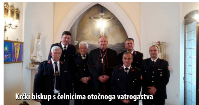
Krčki biskup s čelnicima otočnoga vatrogastva