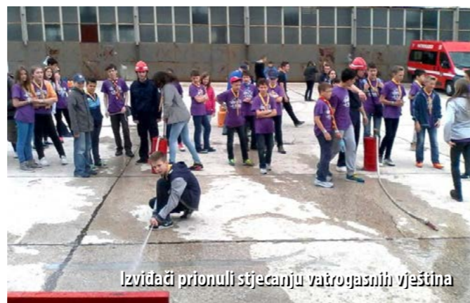
Izviđači prionuli stjecanju vatrogasnih vještina

Pripadnici mladeži DVD-ova Halubjan, Sušak i Šapjane uz pomoć svojih voditelja i kolega iz JVP-a Rijeka prezentirali su svoje vatrogasne vještine. Tako su izviđači imali priliku upoznati vatrogasnu opremu kao i zahtjevnost njezinog korištenja s obzirom na težine vatrogasne zaštitne odjeće, a prezentirano im je i pumpanje na brentači te motanje cijevi. Na pokaznoj vježbi koja je izvedena na prostoru Sveučilišnoga kampusa na Trsatu vatrogasna mladež demonstrirala je gašenje zapaljene boce plina i požara zapaljive tekućine.