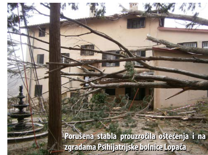
Porušena stabla prouzročila oštećenja i na zgradama Psihijatrijske bolnice Lopača

Od ranih jutarnjih sati pa sve do poslije ponoći, DVD Jelenje na Grobniku i okolici odradio je 10-ak intervencija. Među ostalim, privremeno su pričvrstili krov na školskoj zgradi u Dražicama koji je bura ozbiljno „načela“, sudjelovali su pri intervenciji uklanjanja prevrnutih kamiona na Kamenjaku i Grobničkom polju, a sanirali su i nekoliko požara dimnjaka te uklanjali porušena stabla sa zgrada i HEP-ove stupove.