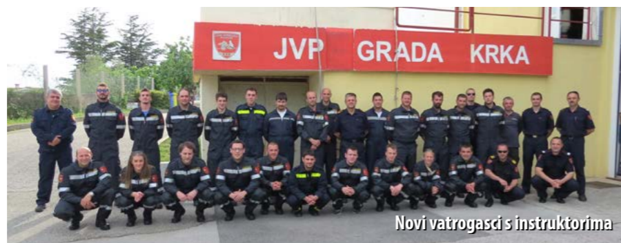
Novi vatrogasci s instruktorima

Polaganjem završnoga ispita, početkom svibnja za pripadnike dobrovoljnih vatrogasnih društava na otoku Krku završeno je osposobljavanje za zvanje vatrogasac. Osposobljavanje je održano zbog nove organizacije i preustroja vatrogastva otoka Krka, odnosno potrebe organiziranja zaštite od požara na područjima koja do sada nisu imala svoje DVD-ove, a to su općine Punat i Malinska-Dubašnica.