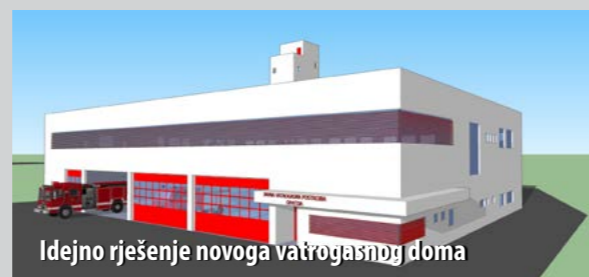
Idejno rješenje novoga vatrogasnoga doma

ronioci koji često sudjeluju u akcijama spašavanja na moru, napomenuo je Filinić te pohvalio i izvrsnu suradnju koju opatijski vatrogasci ostvaruju s riječkom postrojbom, vatrogascima talijanskoga Belluna, potom kolegama iz Kopra, Ilirske Bistrice i Beča. – Ponosan sam na svoje kolege, odlične vatrogasce i velike profesionalce koji žive i promišljaju svoj posao, nesebično pomažući drugima, kad god to treba, rekao je Filinić te se na izvrsnoj suradnji zahvalio i osnivačima – čelnicima liburnijskih lokalnih samouprava na čijem području djeluje JVP Opatija.