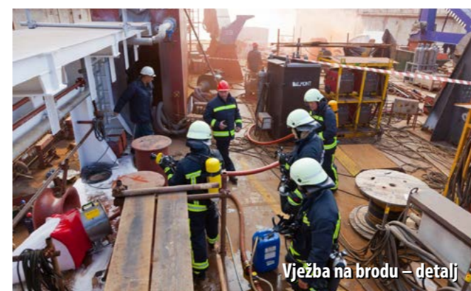
Vježba na brodu – detalj

Neizostavan dio preventivnih aktivnosti su i vatrogasne vježbe. - Najčešće su to vježbe povezane s intervencijama na brodovima, a održavamo ih sa svakom smjenom najmanje jednom na mjesec. Jednom na godinu organiziramo i veliku vatrogasnu vježbu u kojoj sudjeluju i pripadnici JVP-a Rijeka, policija te druge žurne službe. Pored toga, i naši brodari često zahtijevaju održavanje vježbi pa smo tako, primjerice, na američkom ratnom brodu dosad održali dvije vježbe u tri mjeseca i čak su nas pohvalili kao uigranu ekipu, navodi Zoranović.