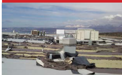
Ogoljeli Konzumov krov u Omišlju