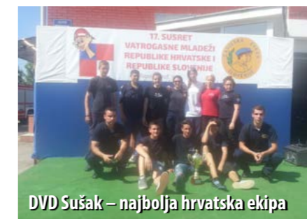
DVD Sušak – najbolja hrvatska ekipa

Sudjelovalo je 10 ekipa iz Slovenije i 21 ekipa iz Hrvatske. Na natjecanje su pozvane po jedna najbolja ekipa iz svake županijske vatrogasne zajednice te Grada Zagreba, ekipe domaćina (DVD Novi Marof) i Varaždinske županije, kao i tri prvoplasirane ekipe s prošlogodišnjeg državnog natjecanja vatrogasne mladeži. Primorsko-goransku županiju predstav-